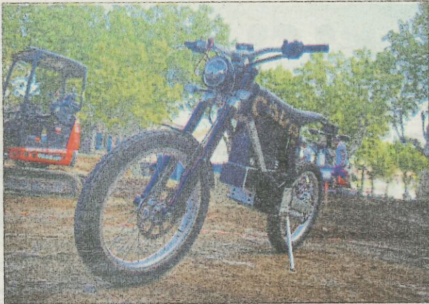
Son petit nom : Cake. C'est sur une bécane comme celle-ci que s'élanceront tous les participants.