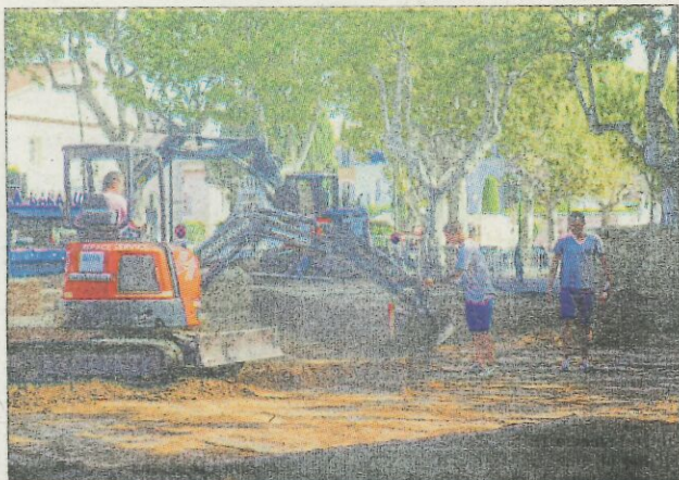
L'installation du circuit a nécessité l'emploi de 1 600 tonnes de terre et de 50 bottes de paille.